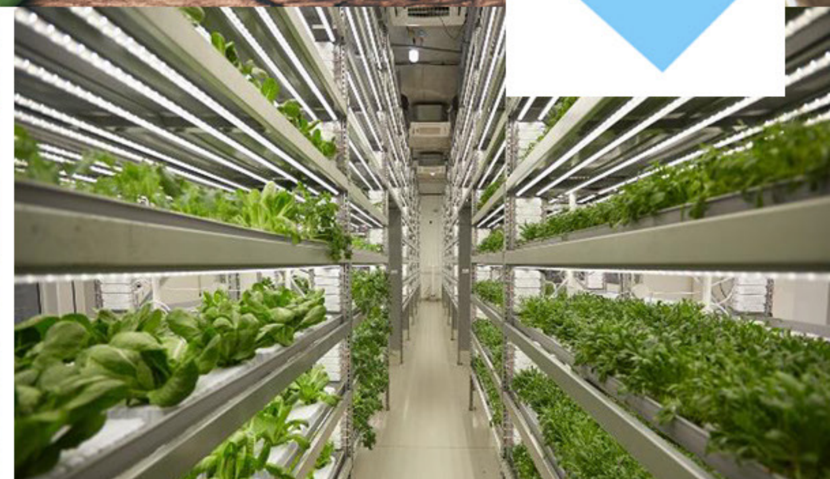
FOOD & TECH / VIILJELYTILAT