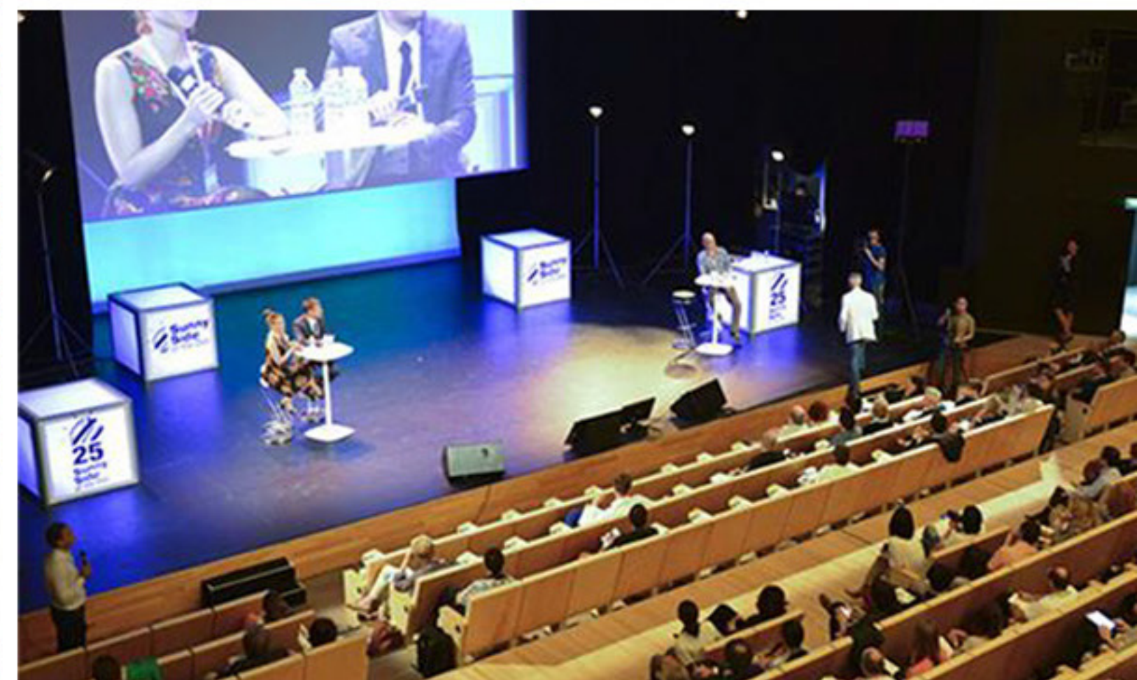
KOKEMUS- & TAPAHTUMAKESKUS