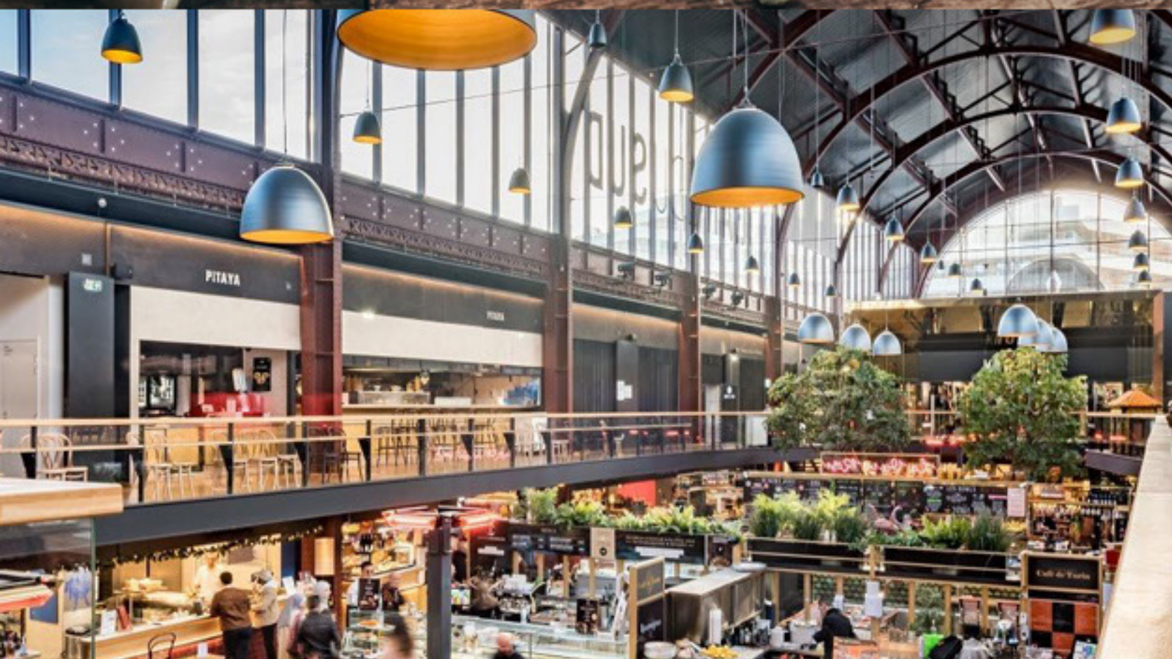
KAUPPAHALLI & RAVINTOLAMAAILMA