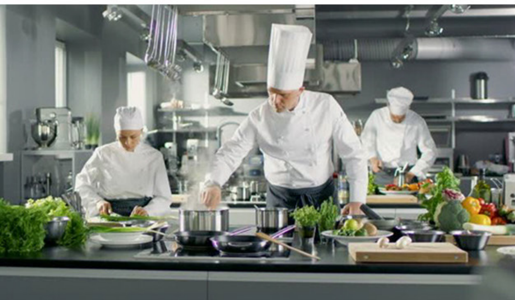
KOEKEITTIÖ & TUOTEKEHITYSLABRA