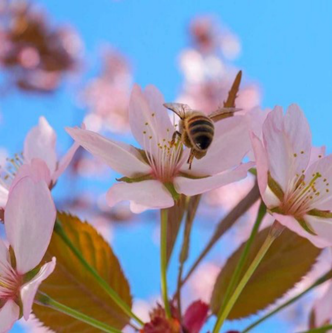
Blommande växter lockar pollinerare.