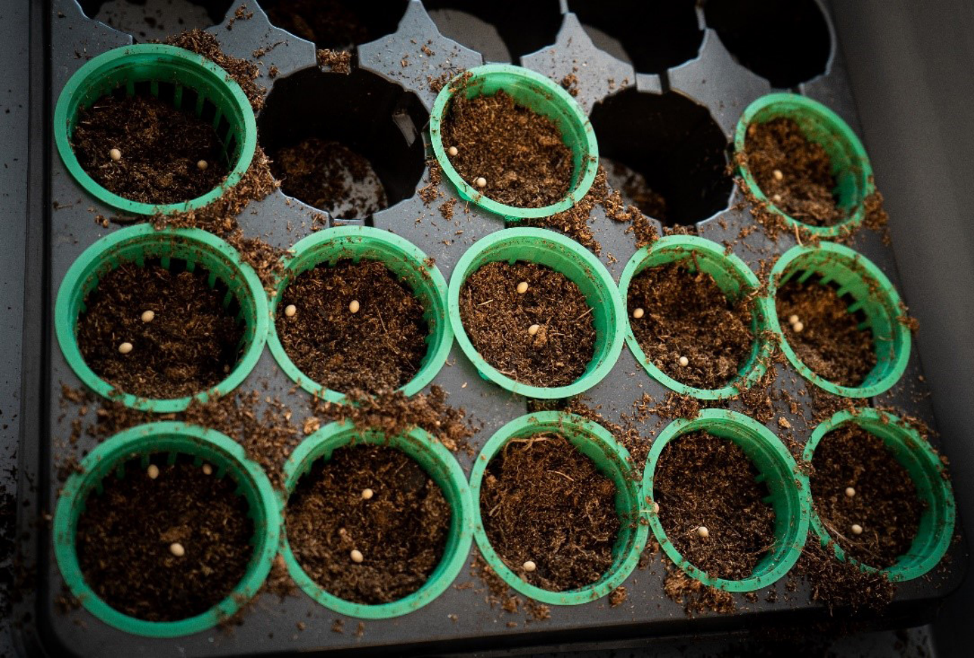
Frön behöver fukt och en lämplig temperatur för att gro.