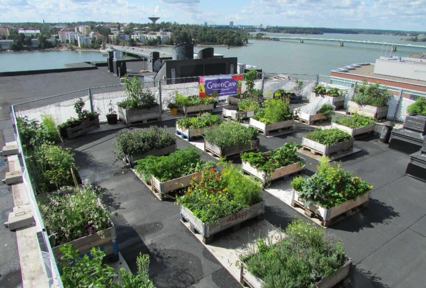
En oasis för pollinerare grönskar på kabelfabrikens tak.