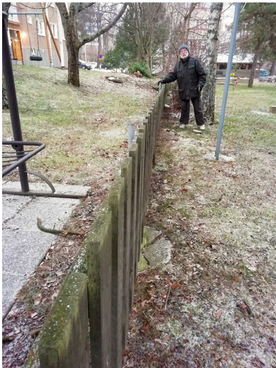
Ett staket mellan gårdarna är inte alltid nödvändigt.

Beslutet om att ta bort staketet fattas gemensamt av bostadsbolagen, men det bolag på vars tomt staketet finns tar bort staketet. I bästa fall får alla boende njuta av en större gård. Det är möjligt att det gamla staketet till och med strider mot stadsplanen, vilket innebär att det är värt att kontrollera med stadens byggnadstillsyn.