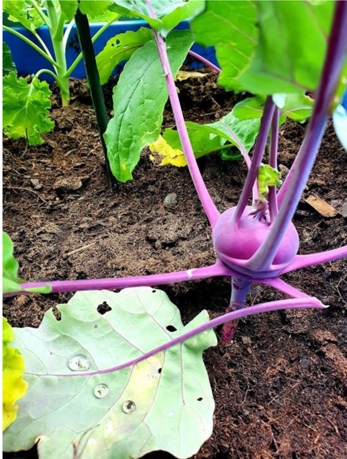
Även kålrabbi ger färg till trädgården.

Mångsidig vegetation skapar livsmiljöer och får olika arter att trivas i stadsmiljöer. Med val av arter kan du påverka mångfalden i den urbana naturen. Blommande växter lockar pollinerare, vilket också gynnar stadsodlare.